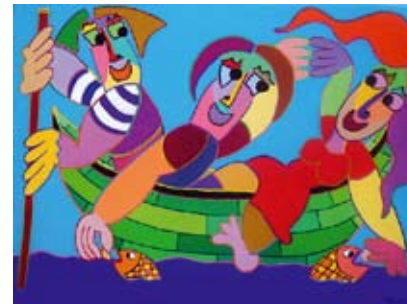
Twan de Vos